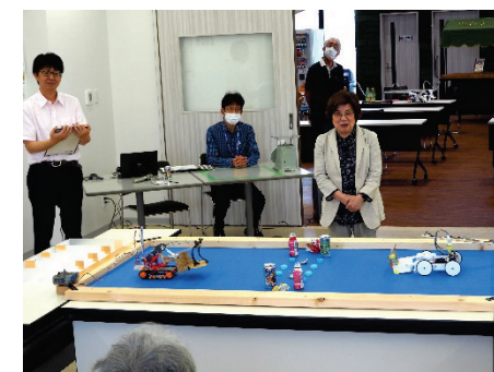
▲開会式（豊田理事長挨拶）