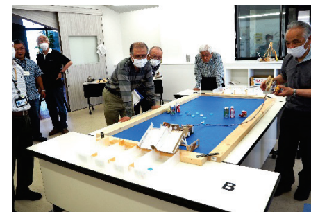
▲デモンストレーション