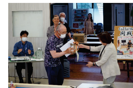
▲閉会式（トロフィー・表彰授与）