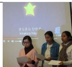
▲きらきら星を歌おう！