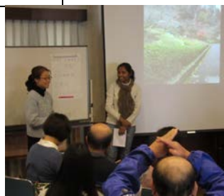
▲会話クラス・発表後〇×クイズ