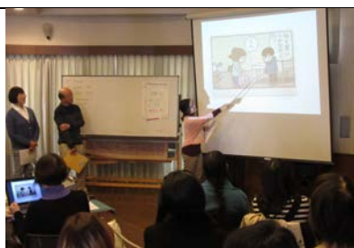
▲総合クラス・4コマ漫画を読む