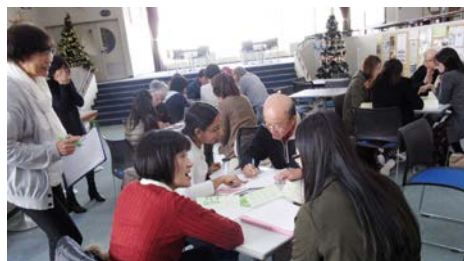
▲学習者の母国語でお誕生日の歌を習うボランティアさん