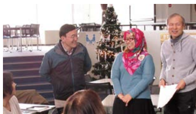
▲インドネシア語で歌う