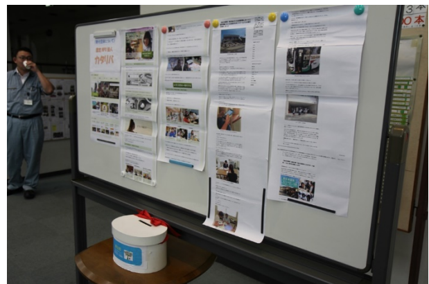
▲寄付先のNPO法人カタリバについて&募金箱