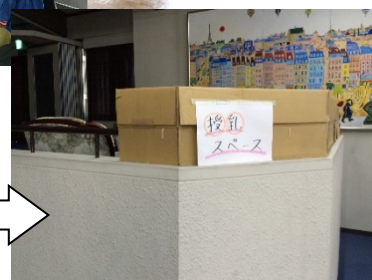
授乳スペースを設置したことで、授乳しながらもゆっくり映画鑑賞していただきました。