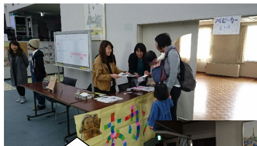
小さなお子様連れの方がたくさん来場されました！