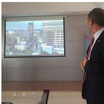
華豊の友の任会長が豊田市と華豊の友を紹介しました。