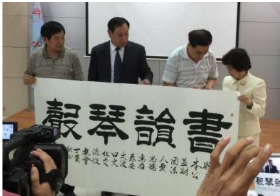
大汶口文化交流促進会のボランティアで著名な書道家より「書」を頂きました