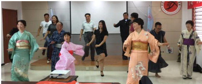
華豊の友のメンバーは、「おいでん踊り」を披露し大汶口文化交流促進会の皆さんも参加しました。