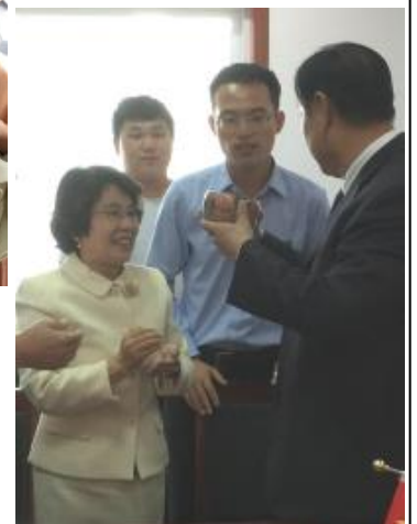
お抹茶のいただき方を教わりながら嗜んだ