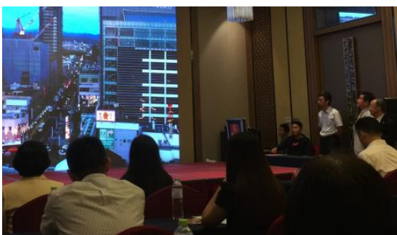
華豊の友 任会長がビデオで豊田市とあすて、華豊の友を紹介しました。