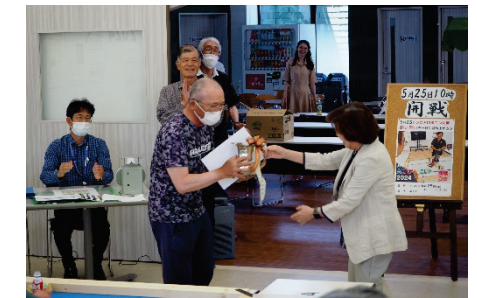
▲閉会式（トロフィー・表彰授与）