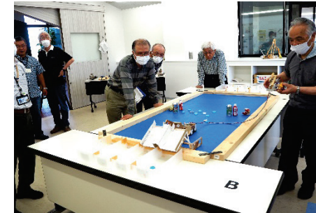
▲デモンストレーション